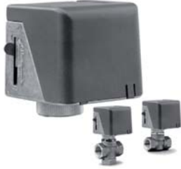
VA-7010 执行器配 VB-5X71 阀门